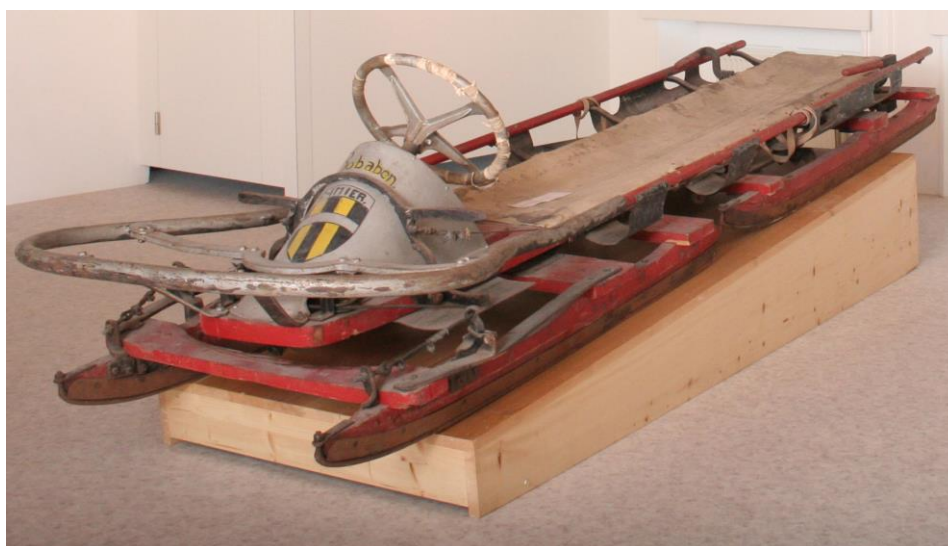
HUM-0629 – Bobsleigh à quatre places, vers 1930-1940

Issus du nouvel intérêt que représentent les montagnes suisses en hiver à la fin du XIX e siècle, les bobs et autres luges deviennent incontournables dans la première moitié du XX e siècle. Les premières pistes de bobsleigh apparaissent dans le Canton des Grisons en